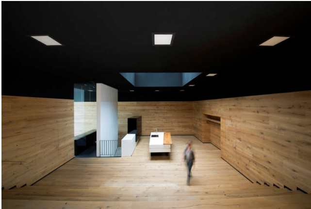
BU: Holzböden und Wandverkleidungen kombiniert mit der Farbe Schwarz stehen für die Manufaktur