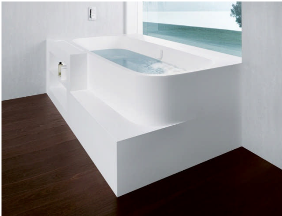
BU: Badewanne mit individuellen Einstiegsstufen und Ablagefächern