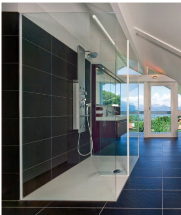
BU: Bodenbündige Dusche in individuellen Abmessungen