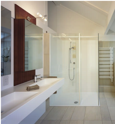
BU: Bodengleiche Duschwanne aus Mineralwerkstoff im Überformat