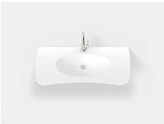
BU: Gesundheitsbecken von Hasenkopf Bild: Hasenkopf-Corian-Waschtisch-Fontana-FOB-Unterfahrbar.jpg