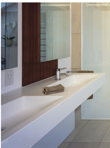
BU: Unterfachbare Waschtische in individuellen Maßen Bild: Hasenkopf-Corian-Waschtisch-unterfahrbar©HUF HAUS.jpg