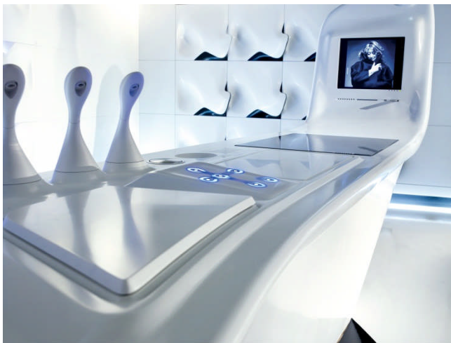
BU: Design und Funktionalität: Kochfeld, LCD-Bildschirm, Aroma-Dispenser Bild: 03_Z Island_by_DuPont_Corion-Hasenkopf.jpg