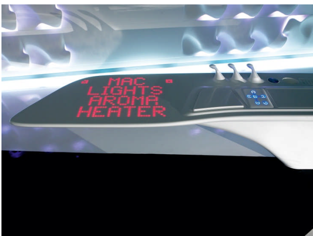
BU: Steuerung von morgen: LED im deutlichen Kontrast mit Corian Bild: 09_Z Island_by_DuPont_Corion-Hasenkopf.jpg