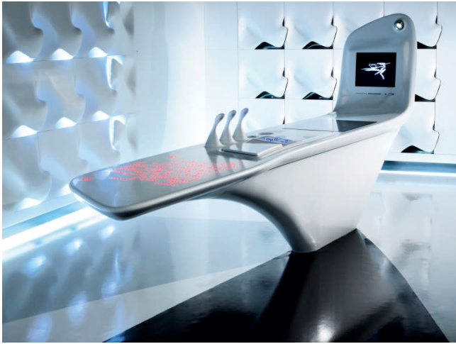
BU: Die Zukunft im Griff: Main-Island mit Touch-Steuerung und LED-Menüführung Bild: 02_Z Island_by_DuPont_Corion-Hasenkopf.jpg