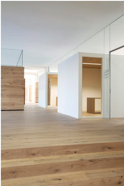
BU: Die Denkerzellen sind regelmäßig angeordnet