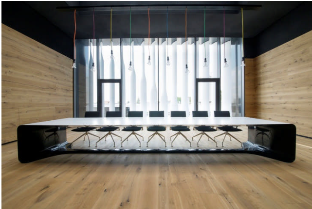
BU: Der große Konferenztisch bietet bis zu 14 Personen Platz Bild: Hasenkopf-Iconic-Award-2014-Corian-Konferenztisch.jpg