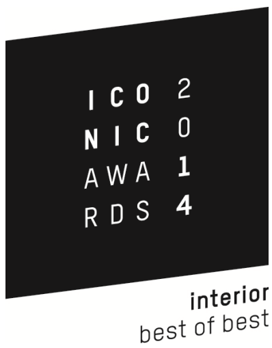
Bild: Hasenkopf-Iconic-Award-2014-INTERIOR_Best of Best.jpg