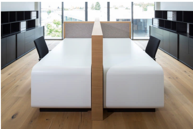
BU: alle Arbeitsplätze sind identisch und großzügig gestaltet Bild: Hasenkopf-Iconic-Award-2014-Corian-Arbeitsplatz.jpg